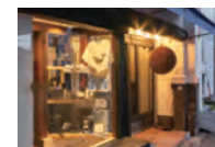
とさごはん 酔鯨亭

住所 〒780-0833 高知県高知市南はりまや町1丁目17-25 電話 088-855-3520 営業時間 17:00～22:30 (L.O.22:00) 定休日 火・水曜