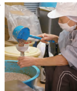
口細の瓶に手作業で丁寧に充填します